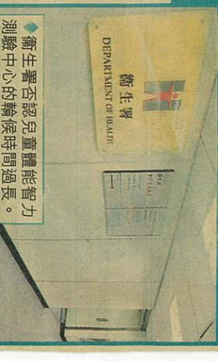
衛生署否認兒童體能智力測驗中心的輪候時間過長。

自閉症三歲前常見病徵 自閉症即兒童發展障礙，一般在三歲前已有明顯的病徵，最明顯是社交上不理會別人及外界事物，迴避他人眼神等；表達能力較弱，說話重複、機械化及冗長，影響與他人溝通，甚至過分執著於一些生活習慣及奇特動作，例如只會穿某種顏色的衣物，否則會發脾氣。