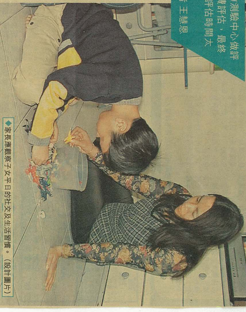
家長應觀察子女平日的社交及生活習慣。(設計圖片)

衛生署發言人表示，該署轄下六間兒童體能智力測驗中心平均輪候時間為四個月。由於需由多位專家會診，故評估會指導候，而在輪候期間，母嬰健康院會指